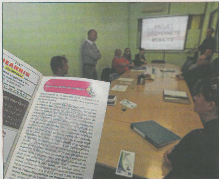
Le comité de pilotage a récemment défini les contours d'un projet qui doit permettre à plus de jeunes d'obtenir le permis de conduire.

Si le dispositif est nouveau à Fréjus, Saint-Raphaël ou à Puget-sur-Argens, il existe à Roquebrune depuis cinq ans.