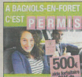
Une initiative intéressante.

Si vous habitez Bagnols-en-Fôret et que vous êtes intéressés, veuillez contactez le 04.94.40.31.50.